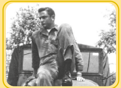
Johnny Cash als Soldat in Landsberg