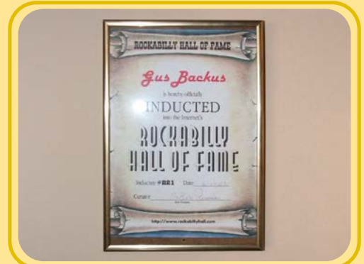
Gus Backus ist in die „Rockabilly Hall of Fame“ und in „The Doo-Wopp Hall of Fame of America“ aufgenommen