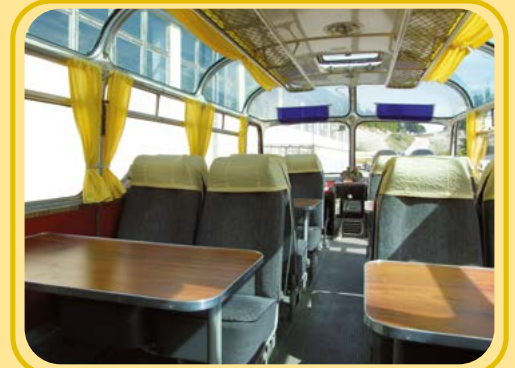
Reisen im Panorama-Bus mit Rock'n'Roll-Musik aus den originalen Lautsprechern - wie in alten Zeiten