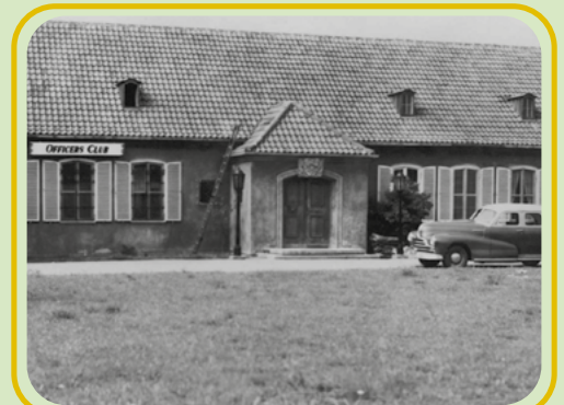
In diesem Kasino hatte Johnny Cash seine allerersten Live-Auftritte, damals mit seinen „Landsberg Barbarians“