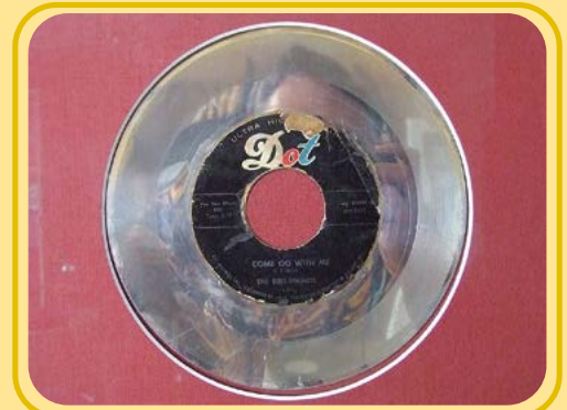
Für die bekannte Hit-Single „Come go with me“ erhielten die Del Vikings eine goldene Schallplatte