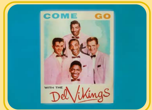
Gus Backus war mit den „Del Vikings“ bei der Geburtsstunde des Rock'n'Roll mit dabei