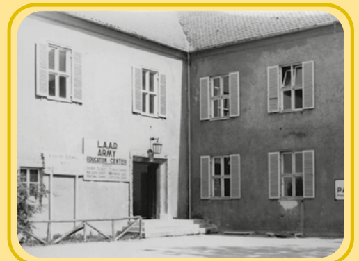
Das ehemalige Zuhause von J.R. Cash, hier wurden die frühen Songs geschrieben