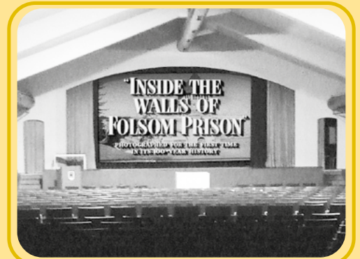
Wir betreten nach über 60 Jahren das Soldaten-Kino, indem Cash zu „Folsom Prison Blues“ inspiriert wurde