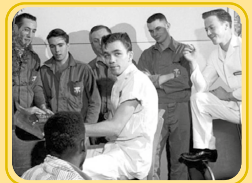
Gus Backus als Soldat in Wiesbaden

So wie Gus Backus der letzte noch lebende „Del Viking“ ist, so ist der Rock'n'Roll-Bus vom Typ „Kässbohrer SETRA S10“ von 1960 ebenfalls ein Zeitzeuge und einer der Letzten seiner Art. Die Fahrt im SETRA ist Reisen wie früher und weckt bereits beim Einsteigen viele schöne Erinnerungen an Damals.