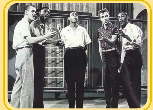
Die Del Vikings hatten einen Auftritt in dem Kinofilm „The Big Beat“, der 1957 in Hollywood entstanden ist