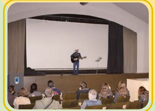
Hier hatte vor uns der junge Johnny Cash gespielt, nun beleben wir diese Halle wieder mit Live-Musik