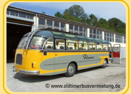
Kässbohrer SETRA S10