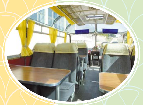
Das Reisen im Panorama-Bus ist ein wunderbares Erlebnis und zudem eine seltene Gelegenheit