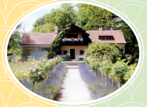
Das Künstlerhaus Gasteiger war für viele Maler ein Treffpunkt und begründete die Künstlerkolonie am Ammersee