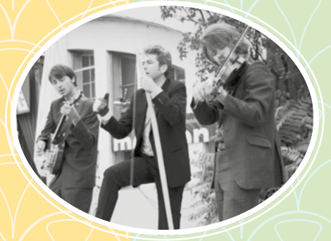
Der Oktober Folk Club spielt für uns mit Banjo, Geige, Mundharmonika und Waschzuber – live und ohne Verstärker